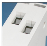
pojemność zacisków 6mm 2

RESIDUAL CURRENT CIRCUIT BREAKER WITH OVERCURRENT PROTECTION FI/LS-KOMBISCHALTER МОДУЛЬНЫЕ КОНТАКТОРЫ PROUDOVÝ CHRÁNIČ S JISTIČEM