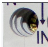
zaciski/śruby ze stali ocynkowanej