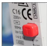
przycisk kontrolny TEST